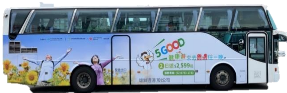
旅遊巴士車體宣傳